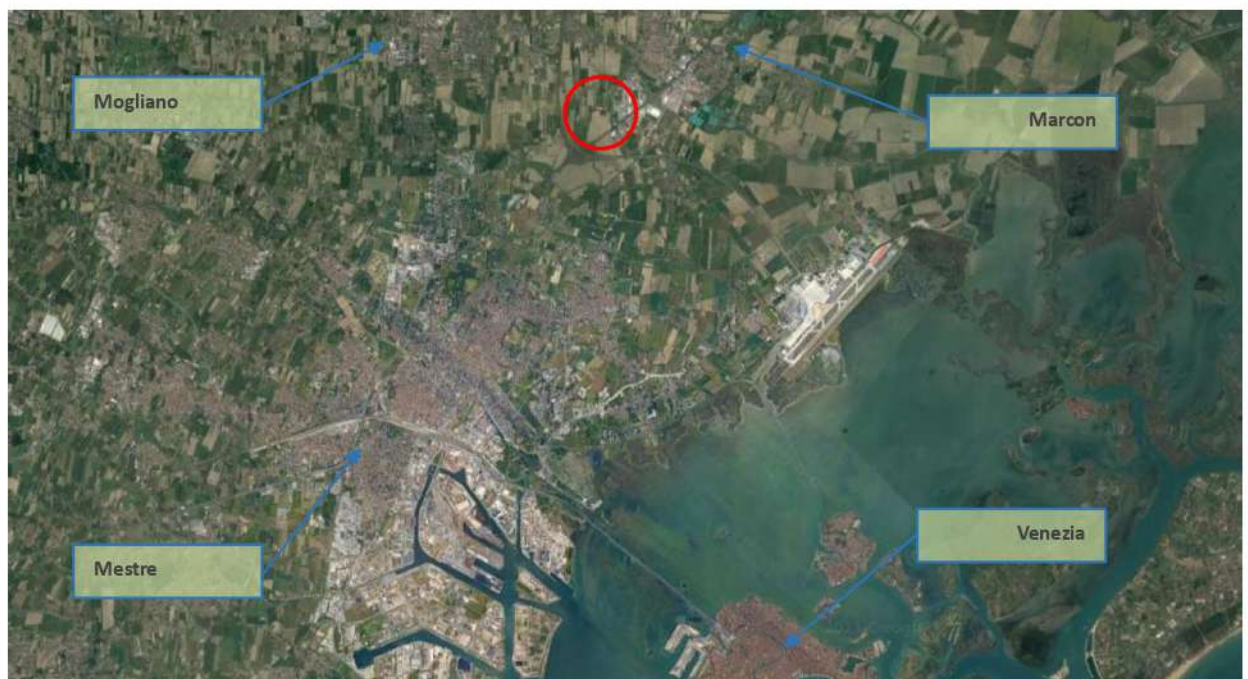
Immagine satellitare con individuazione ambito di riferimento

L'area nel suo complesso confina a nord con Via Treviso, che è anche confine amministrativo tra i Comuni di Venezia e Marcon, e per gli altri lati con terreni agricoli.