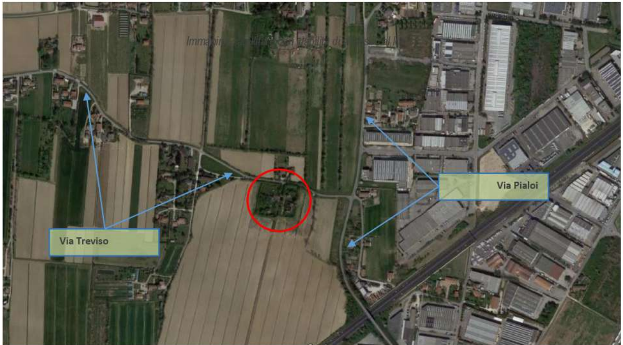
Immagine satellitare con viabilità di accesso al lotto

Caratteristiche zona: periurbana, a spiccata connotazione agricola e con limitata presenza di edifici residenziali; presente nelle vicinanze (come rilevabile nell'immagine sopra riportata) zona industriale del limitrofo Comune di Marcon.